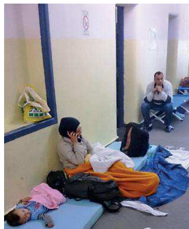
Auch die Flure werden zur Übernachtung genutzt.

nicht wie gewohnt zur Verfügung. Streitereien und Konfliktsituationen unter den Flüchtlingen und andere Einsatzanlässe sind der Grund für die polizeiliche Verstärkung vor Ort. Wenn es zu Einsätzen kommt, ist es durch die Sprachschwierigkeiten für die eingesetzten Polizeibeamten oft