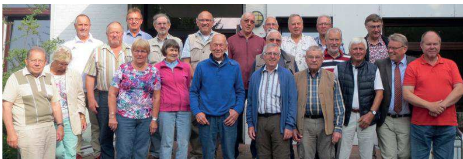
Die Teilnehmer des Seniorenseminars

Themen des neuen Erbrechts, des Verbraucherschutzes und der Entwicklung der Landespolizei bildeten Schwerpunkte des diesjährigen GdP-Seniorenseminars